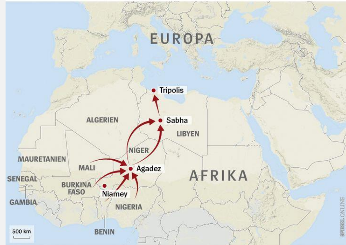
Flüchtlingsrouten durch die Sahara